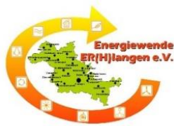
Energiewende ER(H)langen e.V.