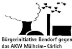
Bendorfer Bürgerinitiative gegen das AKW Mülheim-Kärlich e.V.