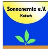
Sonnenernte e.V. Ketsch