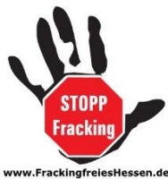
Bürgerinitiative Fracking freies Hessen