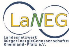
Landesnetzwerk Bürgerenergiegenossenschaft Rheinland-Pfalz e.V. (LaNEG e.V.)