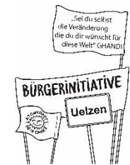
BürgerInneninitiative Umweltschutz Uelzen