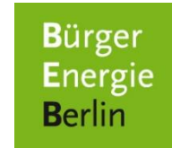
Bürgerenergie Berlin e.G.