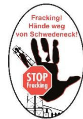
Bürgerinitiative „Hände weg vom Schwedeneck“